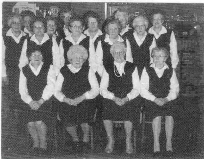
De dames van "De Driesdansers" bij het tien jarig bestaan.

Op 10 maart werd het tien jarig bestaan van de Volksdansgroep "De Driesdansers" gevierd.