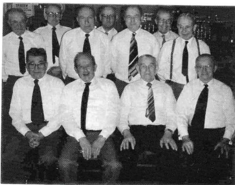
De heren van Volksdansgroep "De Driesdansers" bij het tien jarig bestaan.